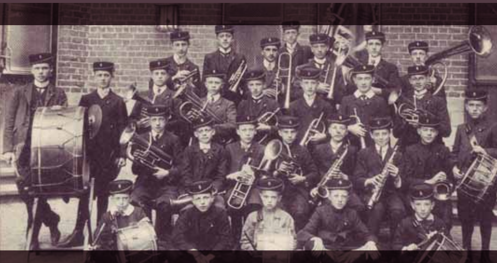
De Sint-Victorfanfare was steeds present bij feesten en uitstapjes, omstreeks 1910.

Eleutheer. Tijdens officiële plechtigheden is de Sint-Victorfanfare altijd present. In 1905, met de herdenking van 75 jaar Belgische onafhankelijkheid, speelt de fanfare op de kiosk. In een huldestoet beelden de leerlingen in negen gekostumeerde groepen met vlaggen en wapenschilden de Belgische provincies uit.