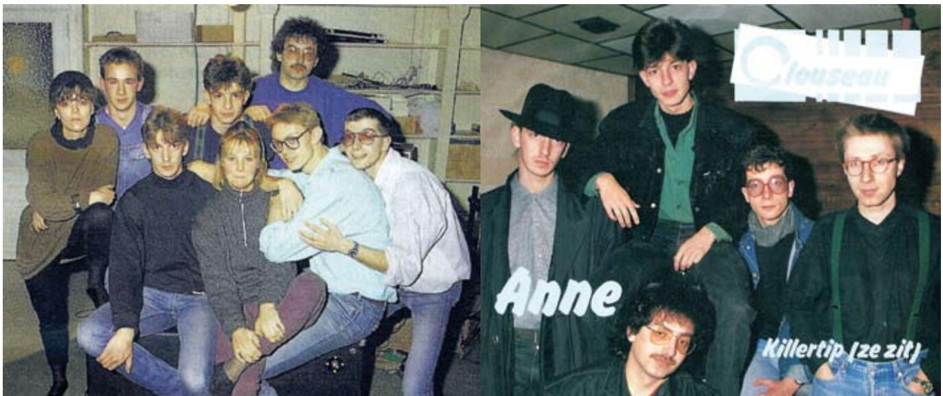
Clouseau in de beginjaren. Naast een hoed waren blijkbaar ook de grote brillen in de mode.

'Interessante weetjes over het Rode van vroeger' is een reeks artikels die gebaseerd is op de 'Geschiedenisshow' die op 30 september 2006 in GC de Boesdaalhoeve verschillende mensen bij elkaar bracht voor een losse babbel over mensen en gebeurtenissen van Rode.