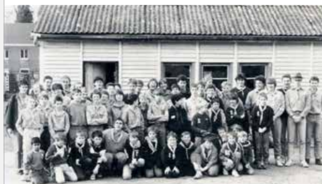
de scouts van ro

info via: pasar.rode@telenet.be , www.pasar.be/KampeerclubRode